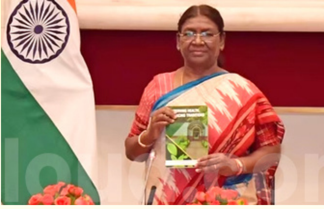
ஓராண்டு பதவிக் காலம் குறித்த மின் நூலையும் வெளியிட்டார்

நடைமுறைகள், இசைக்கருவிகள், விவசாயம் மற்றும் வீட்டு உபகரணங்கள், மூங்கில் கூடைகள், துணிகள், நகைகள், உலோக வேலைப்பாடுகள் போன்ற பல்வேறு கருப்பொருள்கள் இந்த கண்காட்சியகத்தில் உள்ளன. இந்திரா காந்தி தேசிய கலை மையத்துடன் (ஐ.ஜி.என்.சி.ஏ) இணைந்து குடியரசுத் தலைவர் மாளிகையால் இந்த அருங்காட்சியகம் நிறுவப்பட்டுள்ளது.